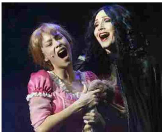
Una scena di 'Rapunzel'